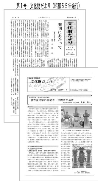
第1号 文化財だより (昭和55年発行)