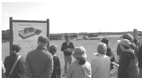
文化財めぐり(斎尾廃寺跡)

倉吉文化財協会では、より充実した活動を行っていくため、会員を募集しています。歴史や文化財に関心をお持ちの方のご入会をお待ちしています。